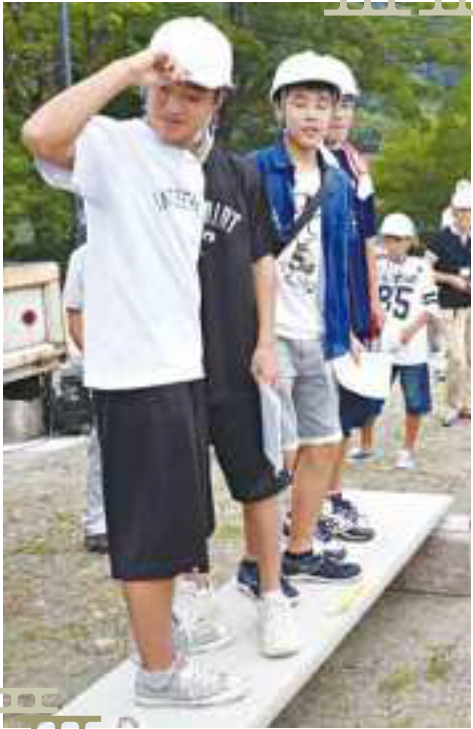
コンクリートの強度テストを体験する子どもたち[田橋市の田橋付け替え工事現場]

東予会場は、小中学生を含め30人が参加した。西条市周布の田橋の付け替え工事現場を見学した。