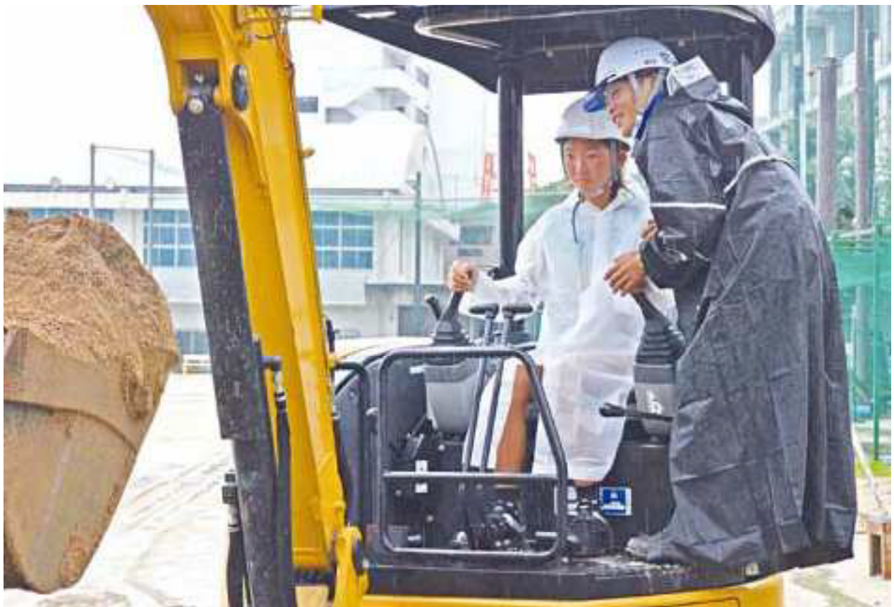
バックホウの操作を体験する子どもたち。「たくさん砂を一度に動かして楽しい」との感想が聞かれた[松山工業高校グラウンド]