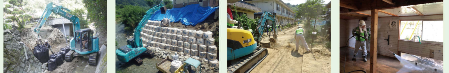
平成30年7月の西日本豪雨における災害復旧支援活動の様子

平成16年9月14日に愛媛県と「大規模災害時における応急対策業務に関する協定」を締結しました。県内で発生した地震・台風等の災害の復旧支援活動を行っています。