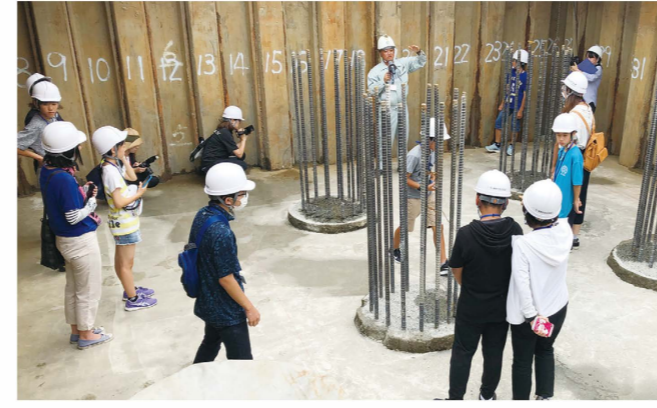
松山外環状道路空港線の橋の土台工事を見学

【重機体験協力会社】 渡邊建設(株)、高橋建設工業(株)、(株)寺田組、(株)久門組、(有)伊藤建設、(有)竹田建設、山下建設(株) 【工事現場見学協力会社】 (株)DAD、(株)愛亀、(株)越智工務店、一若建設(株)