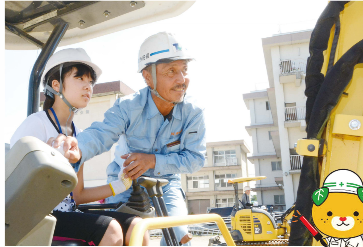
オペレーターの指示でバックホウを操縦する女子中学生