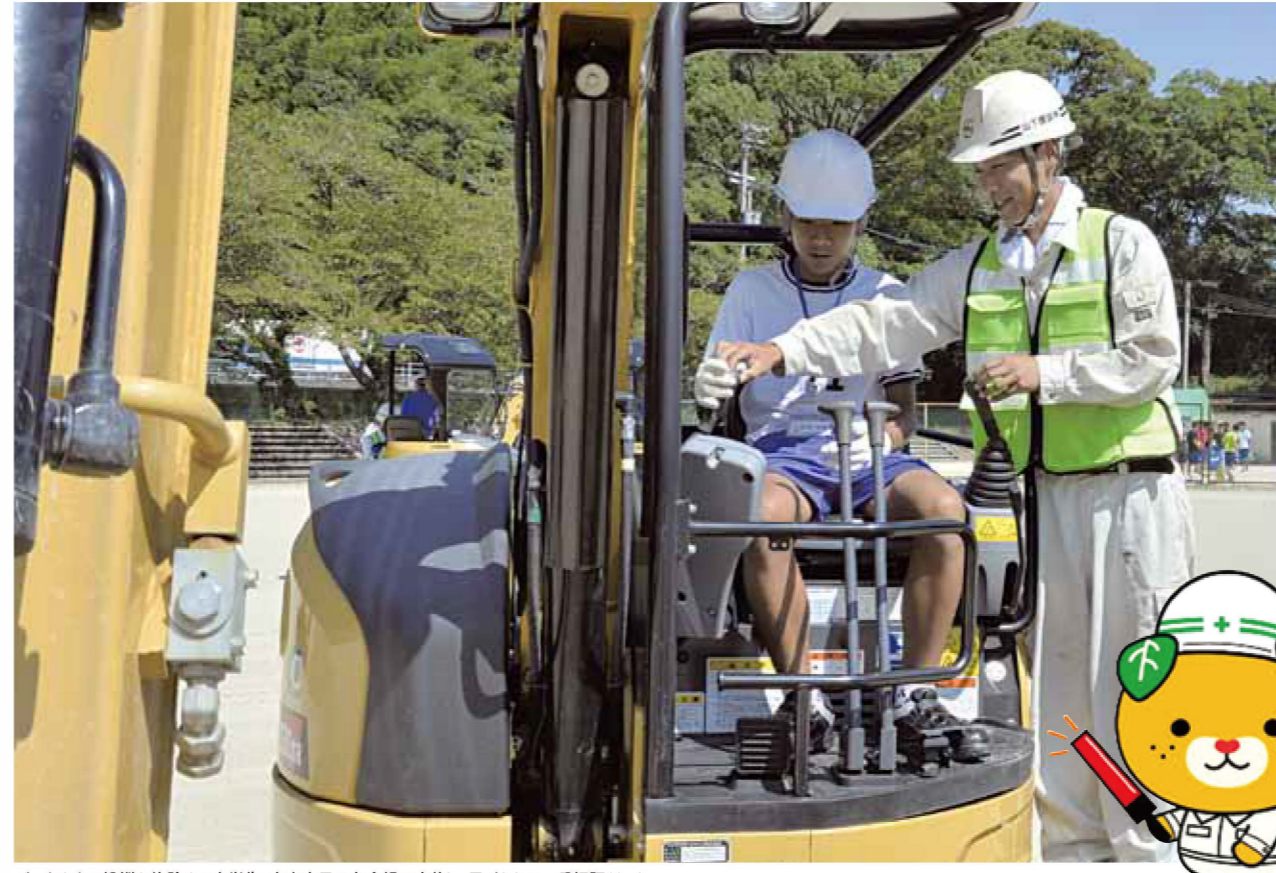
バックホウの操縦を体験する中学生。東中南予の各会場で実施し、子どもらに一番好評だった